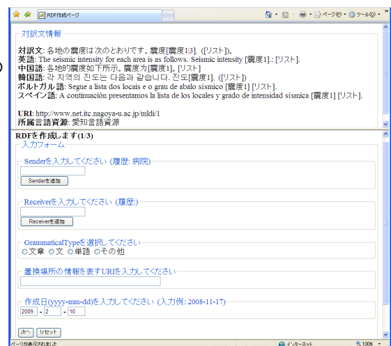
図 2. メタデータオーサリング環境